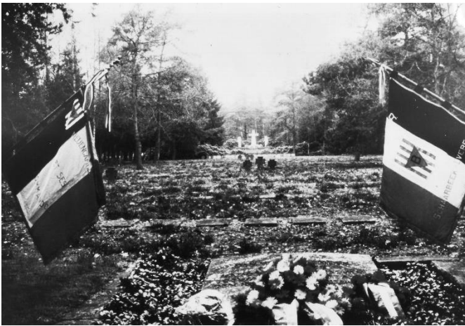
Ansicht des Gräberfelds mit den durch Kissensteine markierten Grablegen von 2786 KZ-Häftlingen.

Zwischen 1954 und 1956 wurden mehrere Massengräber, die um das Stalag X B angelegt waren, mit etwa 3.000 verstorbenen KZ-Häftlingen im Auftrag der französischen Mission de Recherche geöffnet und die Gebeine untersucht. Die Toten, die nicht identifiziert werden konnten, wurden auf den Lagerfriedhof umgebettet.