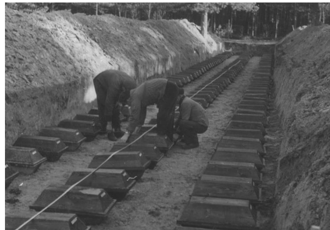
Arbeiter richten die Särge mit den Gebeinen der 1956 umgebetteten KZ-Häftlinge im Gräberfeld II aus.