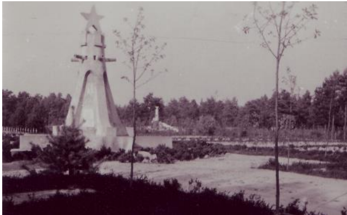
Ansicht des sowjetischen (im Vordergrund) und des polnischen Denkmals. Am rechten Rand sind mittlerweile überformte Massengrabreihen mit einer bis heute nicht geklärten Zahl von verstorbenen sowjetischen Kriegsgefangenen erkennbar.

Kriegsgräberstätte Sandbostel Bevener Str. o.Nr.; 27446 Sandbostel