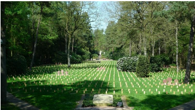
Zum 67. Jahrestag der Befreiung am 29.4.2012 wurden die einzelnen Grablegen in einem Visualisierungsprojekt temporär wieder markiert.

Hier wurden auf je zwei der Grablegen ein nicht beschrifteter Kissenstein zur Markierung gelegt. 1986 wurden die Kissensteine wegen der besseren Pflege durch die Gemeinde ersatzlos entfernt.