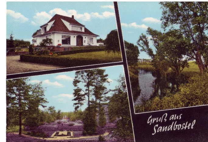
Dreifelder-Postkarte aus den 1960er-Jahren. Links unten ist der Lagerfriedhof zu erkennen